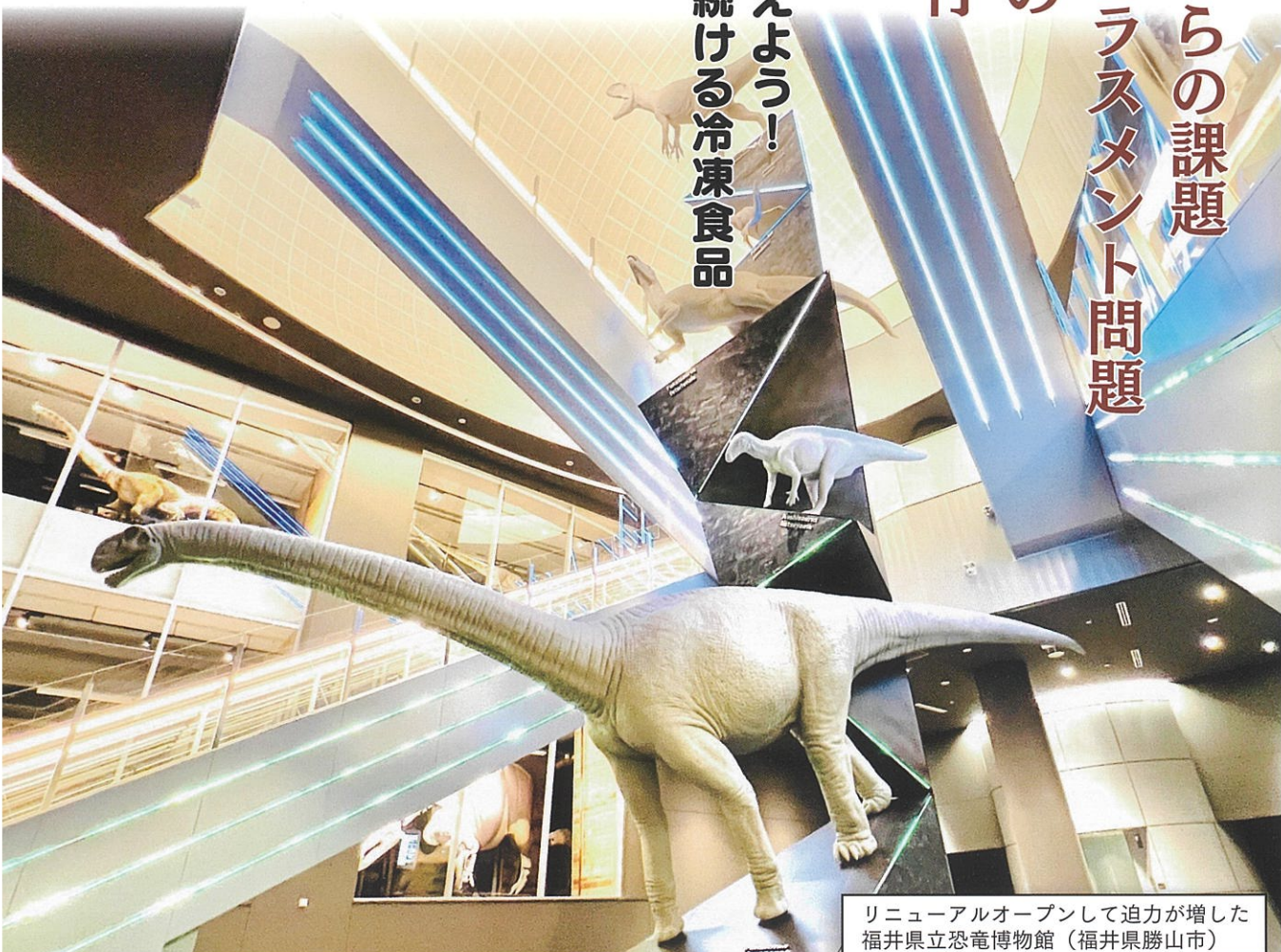
リニューアルオープンして迫力が増した 福井県立恐竜博物館（福井県勝山市）

紅麴サプリ事件の顛末とこれからの課題 消費生活相談員のカスタマーハラスメント問題 有名人の写真を勝手に使って偽の 投資サイトに誘導する手口が横行