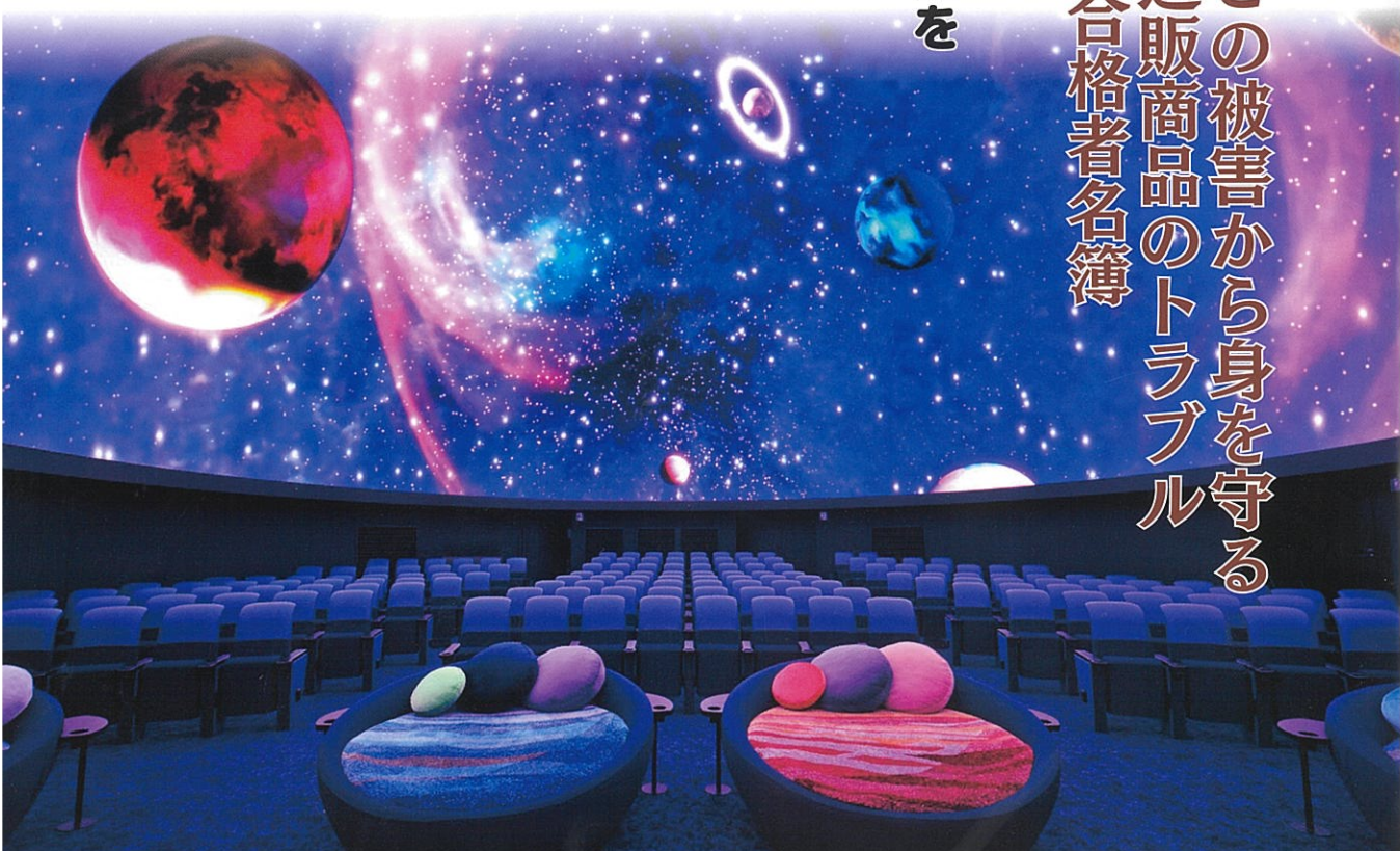
贅沢な座り心地のプラネットシート 「プラネットリアYOKOHAMA」(横浜市)