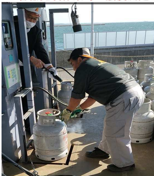
変色なし(ブタン検出せず)