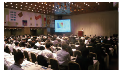
ウィズガスシンポジウム