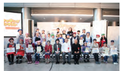
クッキングコンテスト