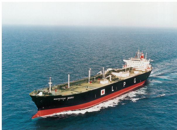
オーシャンタンカー

LPガスの流通は、輸入と生産を行う「元売業者」、LPガスの容器に充填を行う「卸売業者」、各家庭へLPガスを販売する「小売業者」によって構成されています。近年では、LPガスの流通経路を短縮した物流合理化等を図るケースも見受けられます。