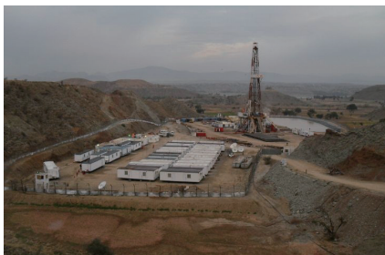
陸上油田 (パキスタン)