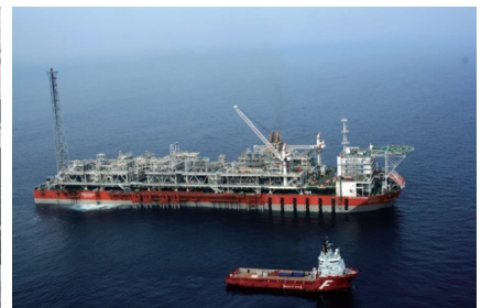
洋上ガス田 (アンゴラ)