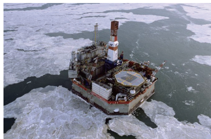
洋上ガス田 (ロシア・サハリン)