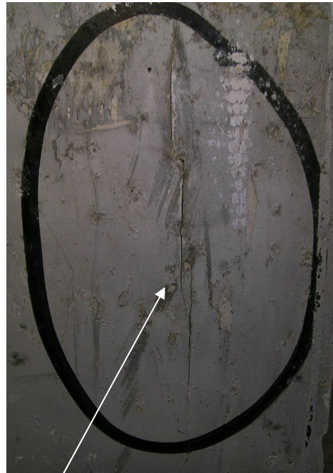
縦方向に発生した亀裂