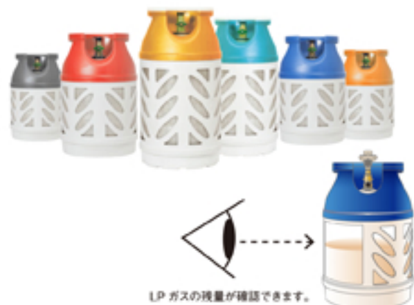
LPガスの残量が確認できます。

カラフルで美観性に優れており、室内設置にフィットするデザインです。プラスチック製のため、床材を傷つけにくく、また本体容器が半透明でLPガス残量を目視確認できるため、ガス切れ防止に役立ちます。